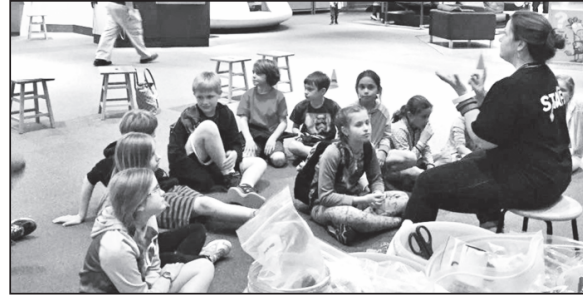
Bostono mokslo muziejaus programos, skirtos mažiesiems, vedėja pritraukė Bostono lituanistinės mokyklos vaikų dėmesį

Po pusryčių patekome į planetaariumo demonstraciją. Įsitaikę itin pa-