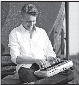
Prieš filmą – lietuvių muzika – 11 psl.