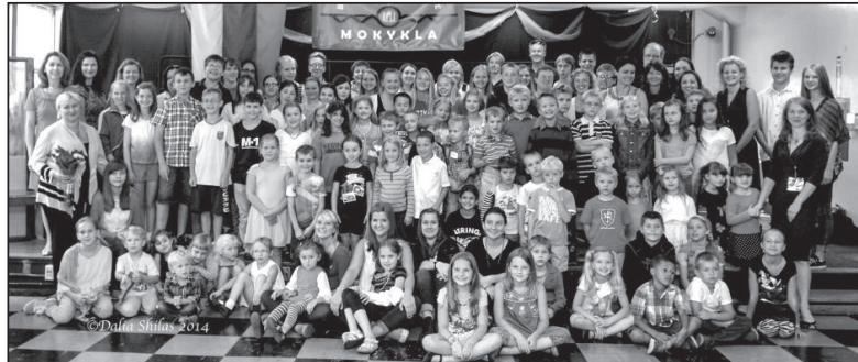
Į Bostono liuanistinės mokyklos metų atidarymą sugužėjo beveik 120 mokinių, per 20 mokytojų ir pagalbininkų, daug tėvelių ir svečių.