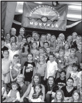
Bostono praeitis, dabartis ir ateitis – 4 psl.