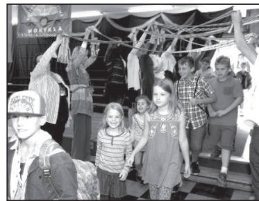
Jau 65-ąjį rudenį Bostono lituanistinė mokykla po mokytojų išlektomis tautinėmis juostomis visus sukvietė į mokslo metų pradžios šventę.