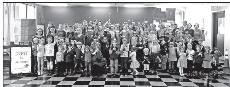
Išsamžinome bendroje nuotraukoje.