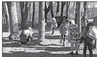
Lauke moksleiviai sukūrė neužmirštuolių pievą, taip prisimindami, kodėl esame laisvi.