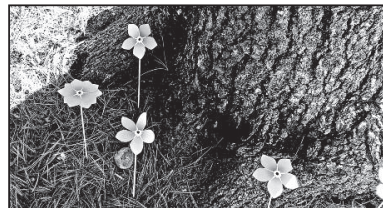
Mažieji nuspalvino neužmirštuoles, simbolį, skirtą Sausio 13-ajai atminti.