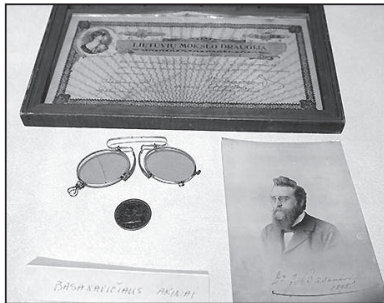
Jono Basanavičiaus akiniai, saugomi Baltimorės Lietuvių muziejuje.