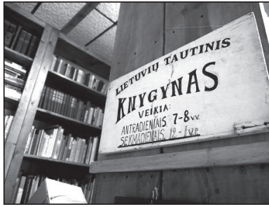
Lietuvių tautinis knygynas Baltimorės Lietuvių namuose.

Lietuvos įmonės. Naujas etapas Lietuvos ir JAV ryšių istorijoje: lietuviškas vietas Amerikoje kuria ne vien Amerikos lietuviai, o ir pati Lietuva. Žinoma, tokių vietų mažoka. Bet gal ir gerai: daug svarbiau išsaugoti tai, kas jau sukurta. Laimė, Baltimorėje niekam, atrodo, sunykimas dar negresia, ir tikiu, kad po 5 metų bus galima išvysti tas pačias lietuviškas vietas.