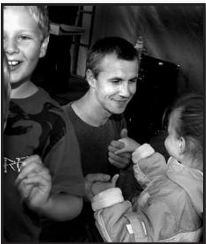
Šeima – lietuvių tautos gyvybės lopšys – 10 psl.