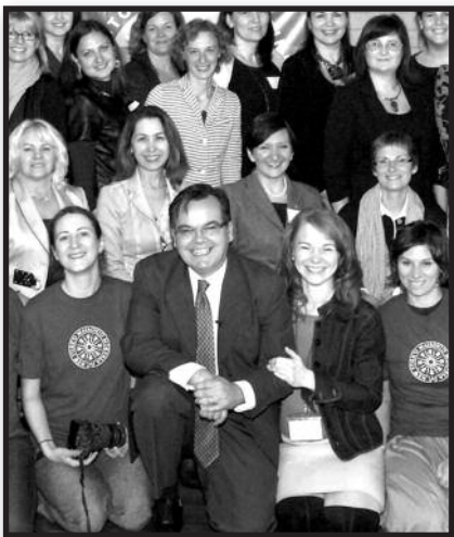
Mokytojų seminaras: nuo teorijos – prie praktikos – 4 psl.