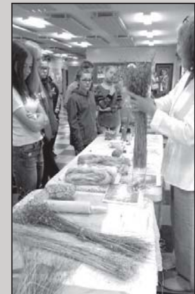
procese. Mokiniai linksmai kūrė linus, kad išbūrėtų sėklos. Po to galėjo suminti linus mintuve, kad išbūrėtų spalvą, o po to ir sušukuoti.