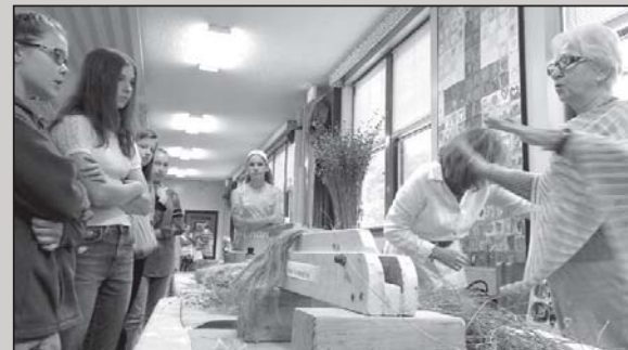
Bostono lituanistinės mokyklos mokiniai ne tik naujų žodžių apie linus išmoko, bet ir rątomis prisilietė prie lino kelio.

Kelias tęsėsi toliau: mokiniai galėjo rątomis ne tik paliesti užaugintus linus, bet patys dalyvauti visame