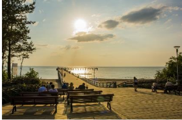
Tiltas į Baltijos jūrą